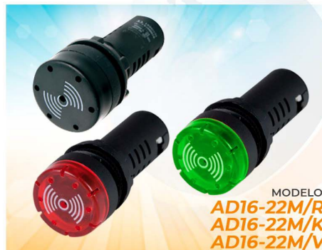
MODELO AD16-22M/R AD16-22M/K AD16-22M/V